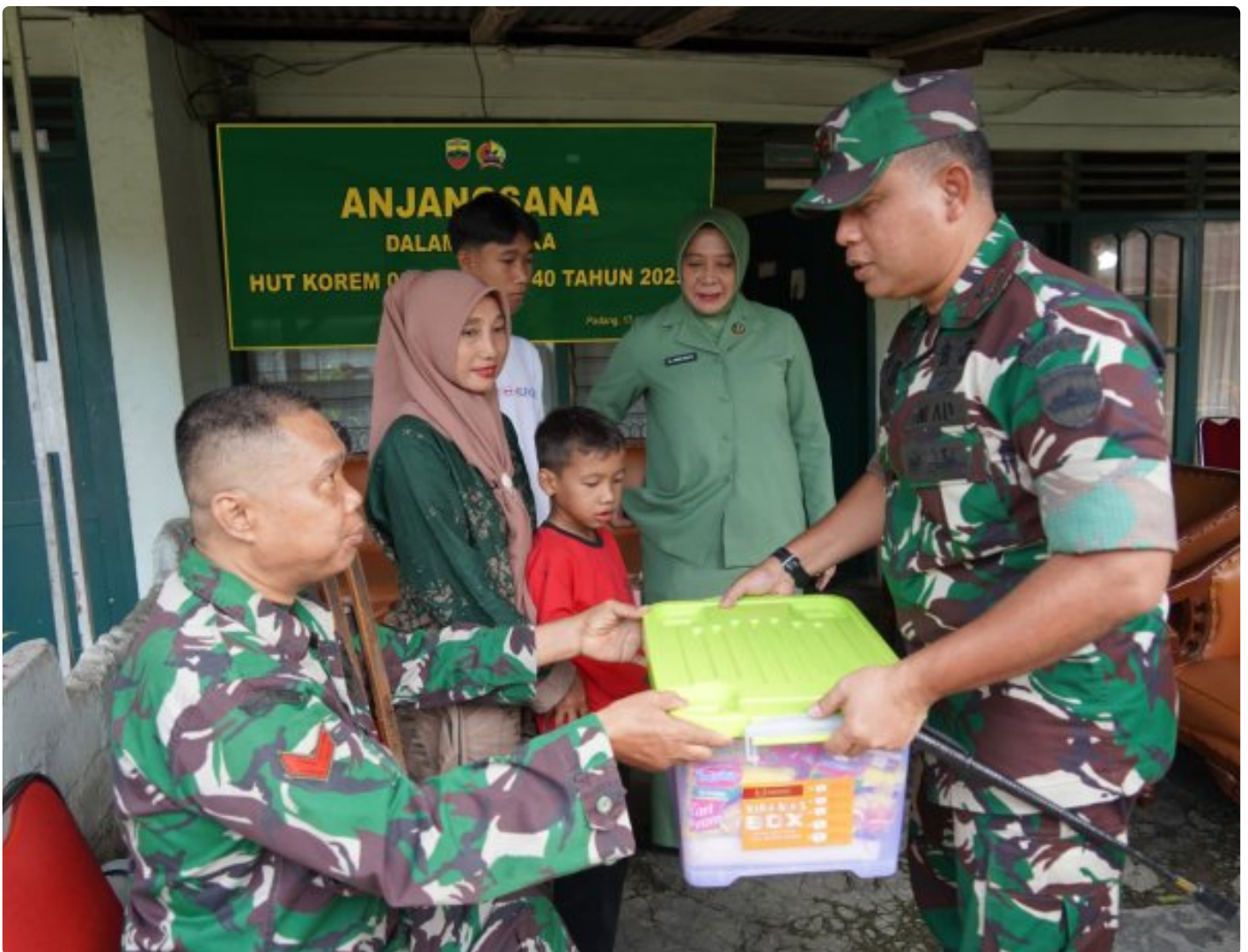
Padang, - Serangkaian kegiatan sosial digelar menjelang HUT ke 40 Korem